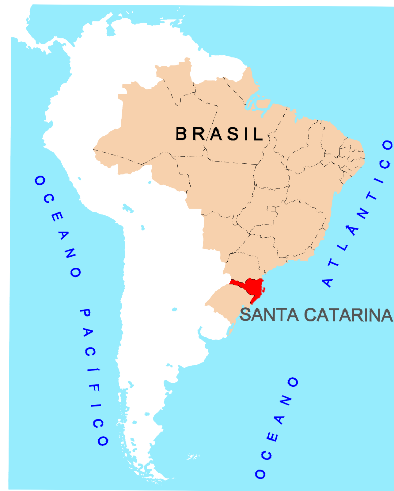
EDIÇÃO GRÁFICA PREFEITURA MUNICIPAL DE PESCARIA BRAVA