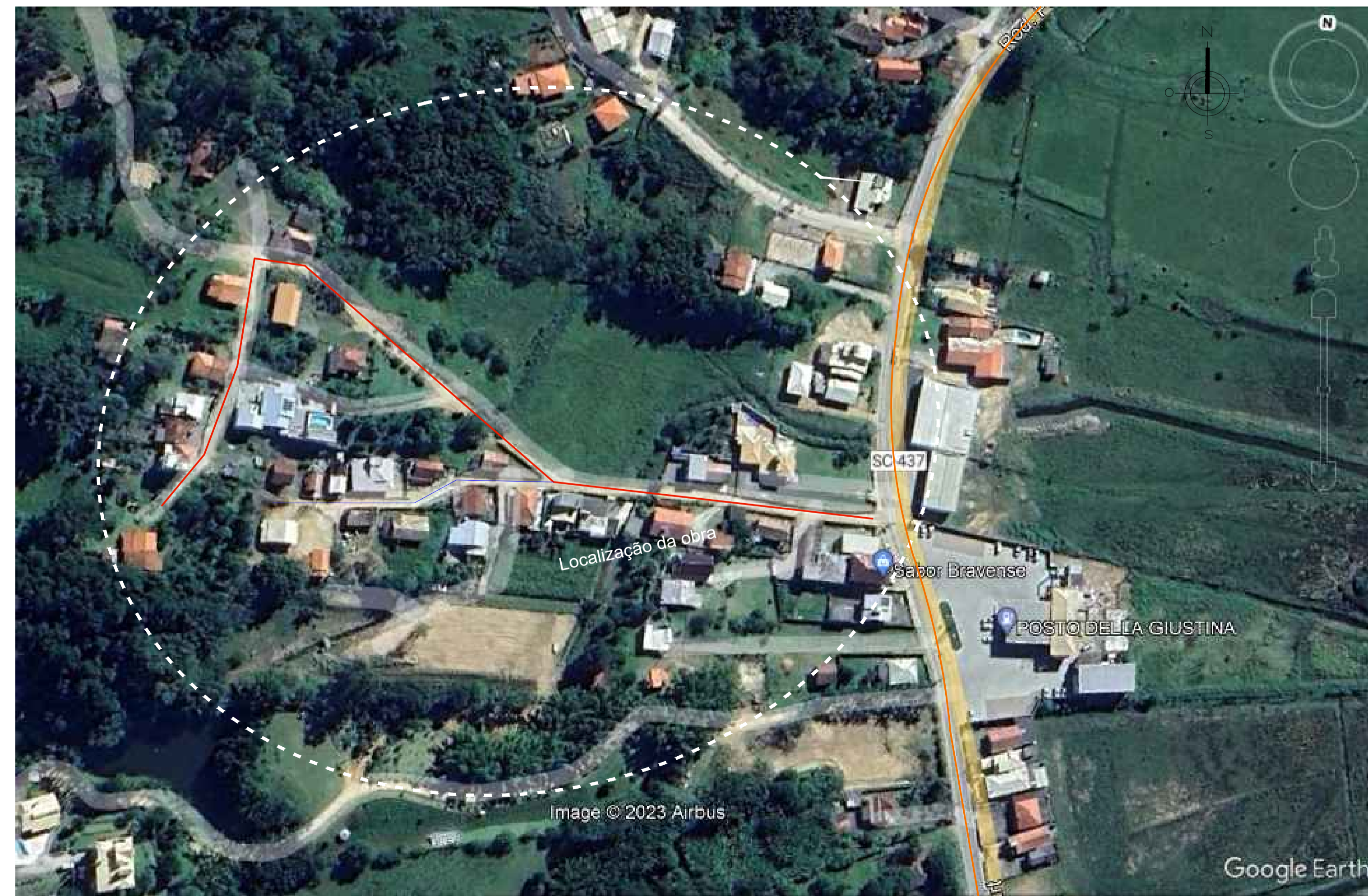
LOCALIZAÇÃO RUA ALBINO ANTÔNIO BORGES E PAULO GONÇALVES VIEIRA SEM ESCALA