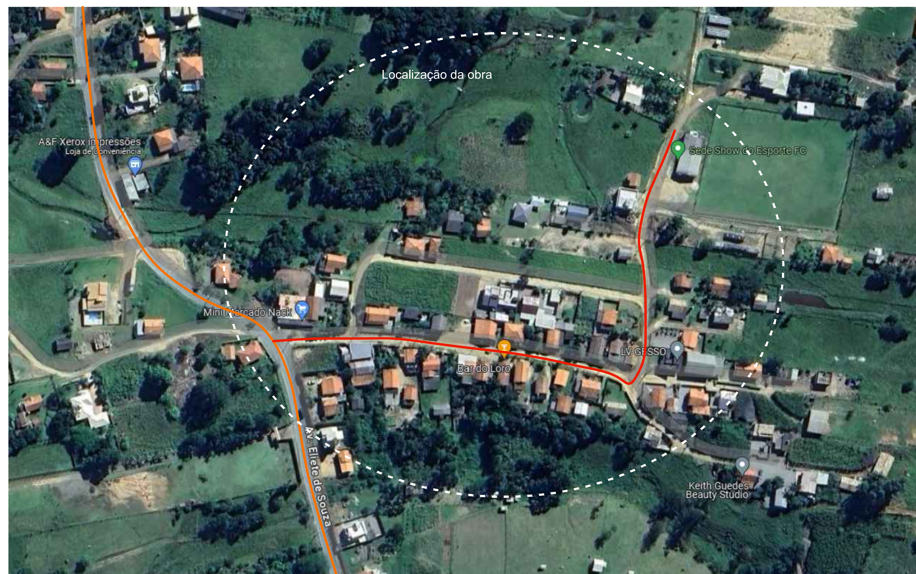
PLANTA BAIXA DE LOCALIZAÇÃO SEM ESCALA