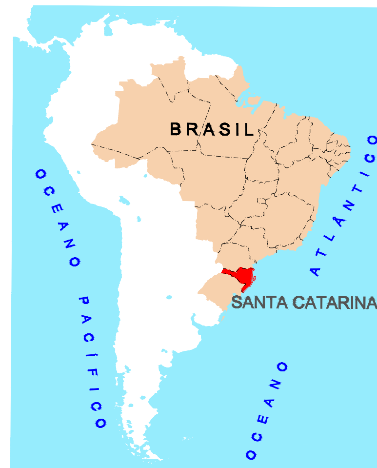
EDIÇÃO GRÁFICA PREFEITURA MUNICIPAL DE PESCARIA BRAVA SEM ESCALA