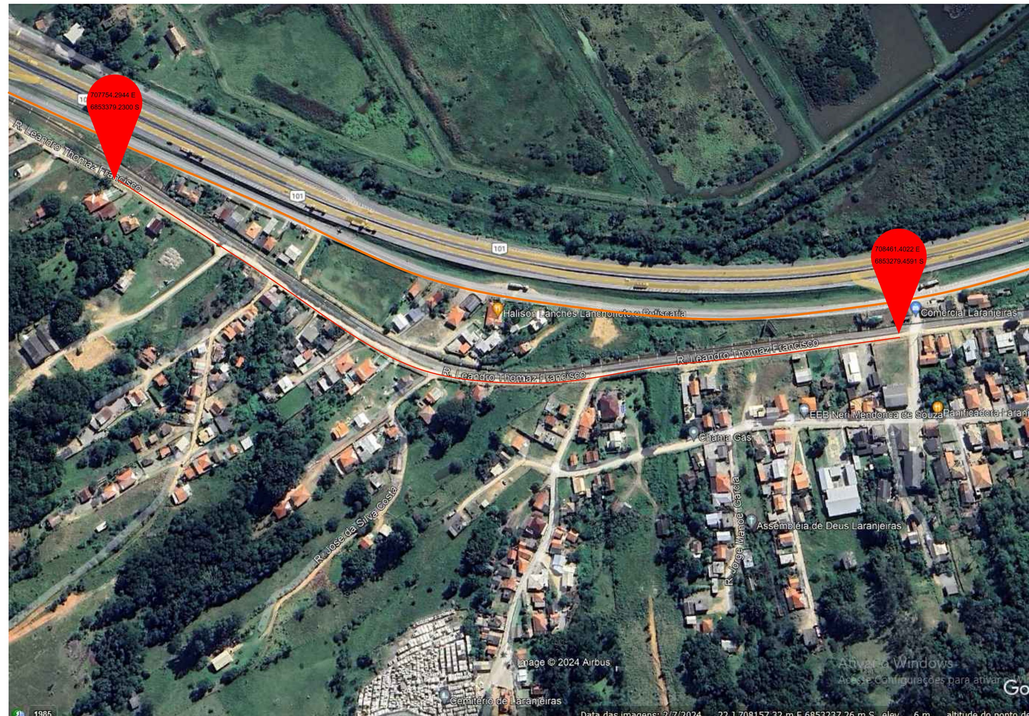
PLANTA BAIXA DE LOCALIZAÇÃO SEM ESCALA