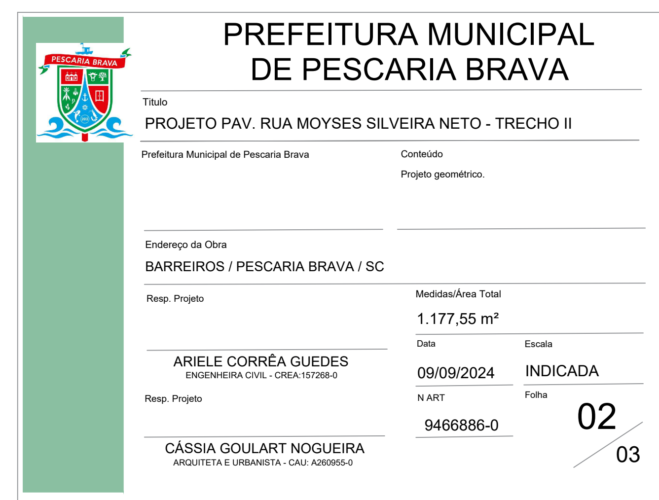
PROJETO DE PAVIMENTAÇÃO - ESTACA 0 Á 9+12,56m ESCALA 1:250